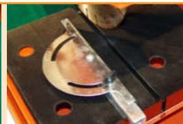
Variable Winkelschnittführung mit Gradskala.