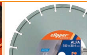
Wir empfehlen den Einsatz der Diamantscheibe Clipper ALFA.