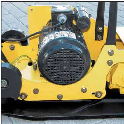
Der leistungsstarke Elektromotor ist wartungsfrei.