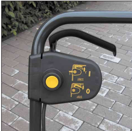
Hohe Bediener-sicherheit durch Sicherheitsschaltgriff.