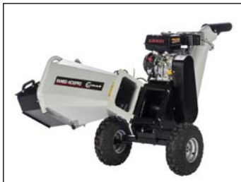
Klappbarer Ein- & Auswurftrichter