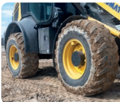
100% Differentialsperre, vorn und hinten (optional)