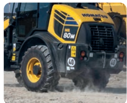
Schnellläuferversion mit 40 km/h hydrostatischem Antrieb (optional)